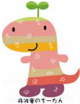
丹波竜のすーたん